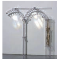
Rainbow Trusses (mediterranean suggestion with edhera) , 2009 340 × 212 × 95,5 cm

Les Monologue Patterns (Motifs de monologue), 2004 – 2007, se présentent comme des roulettes : habitat, intimité et nomadisme créent une enclave à part dans le lieu de l'exposition, nous confrontant à un micro-univers étrange, habité de plantes grasses, visibles par transparence, brouillant les frontières entre extérieur et intérieur.