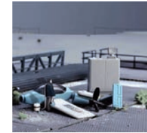
No casting (untitled) , 1997, 181 × 181 cm Galleria Continua San Gimignano/Beijing/Le Moulin

Morphic Resonances , 2004 – 2007 reprend le thème de l'habitat (voir Monologue Patterns ou Painted Distances ). Cette fois-ci Cecchini joue avec les formes de la sculpture et de l'architecture, intégrées à un système de prolifération organique et naturel, « larve-niche » insérée dans le mur, cette termitière accueille un lit, révélant ainsi une sorte de milieu biologique domestique, abrité et ouvert sur l'extérieur.