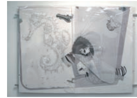
The monologue drawings (project for a transparent boat) , 2005 150 × 200 cm

Le grand Wall Drawing (dessin mural), 2010, présenté dans la salle centrale fonctionne comme une sorte de trompe-l'œil réduit à l'essentiel, réalisé en utilisant le plan horizontal d'un logiciel de modelage tridimensionnel comme un paysage mental et physique en distorsion.