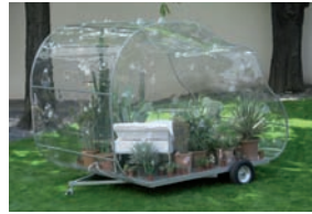
Monologue Patterns I , 2005 – 240 × 350 × 230 cm Courtesy Galleria Continua San Gimignano/Beijing/Le Moulin

Loris Cecchini travaille par séries, qu'il décline sous des titres génériques, et dont quelques unes sont commentées ci-après.