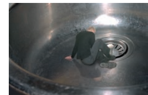
Pause in background , 1996, 40 × 60 cm Galleria Continua San Gimignano/Beijing/Le Moulin

La série No casting (sans casting/sans moulage), 1997 – 2000, évoque des maquettes de décors de cinéma. Un jeu s'instaure dans ces images sans scénario, sans unité, si ce n'est celle du non-sens, de la possibilité d'une situation, de la neutralisation d'un décor non-remarquable créant des situations non-dramatiques.