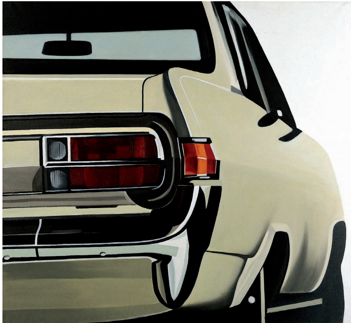
Peter Stampfli, Rallye , 1964 Acquisition, 1979

La Terrasse – BP 80241 42006 Saint-Étienne Cedex 1 Tél. +33 (0)4 77 79 52 52 mam@agglo-st-etienne.fr www.mam-st-etienne.fr