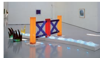
Martial Raysse, Proposition to escape : Heart Garden , 1966 Acquisition, 2002

Les Nouveaux Réalistes quant à eux, puis les proches ou héritiers de Fluxus à leur tour, puisent dans le réel la force évocatrice ou poétique de leurs œuvres : accumulés ( Arman ), assemblés, détruits ( César ) ou oblitérés ( Sacha Sosno ), les objets y sont souvent mobilisés de manière directe. La violence de certaines œuvres ( Wolf Vostell , B52 ) laisse entrevoir que l'envahissement généralisé des « choses » ne va pas sans une angoisse certaine. La question de la représentation de l'objet industriel dans les médias est parallèlement mise en question, dans une société d'après-guerre où tous les idéaux ont partie liée avec la consommation : Alain Jacquet brouille la vision par l'agrandissement de la trame photographique et joue de la sérialité : ses Bulldozers (1973) deviennent fantomatiques et insignifiants à la fois. Autour de Fluxus s'expérimentent de nouveaux usages de l'objet : Ben fabrique d'insolites boîtes et kits moins pratiques que métaphysiques, il trouve dans un réchaud le territoire pour ses idées ( Siège des idées , 1977).