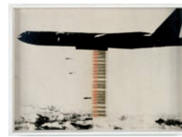
Wolf Vostell, B52 , 1962 Acquisition, 1994

Les Nouveaux Réalistes quant à eux, puis les proches ou héritiers de Fluxus à leur tour, puisent dans le réel la force évocatrice ou poétique de leurs œuvres : accumulés ( Arman ), assemblés, détruits ( César ) ou oblitérés ( Sacha Sosno ), les objets y sont souvent mobilisés de manière directe. La violence de certaines œuvres ( Wolf Vostell , B52 ) laisse entrevoir que l'envahissement généralisé des « choses » ne va pas sans une angoisse certaine. La question de la représentation de l'objet industriel dans les médias est parallèlement mise en question, dans une société d'après-guerre où tous les idéaux ont partie liée avec la consommation : Alain Jacquet brouille la vision par l'agrandissement de la trame photographique et joue de la sérialité : ses Bulldozers (1973) deviennent fantomatiques et insignifiants à la fois. Autour de Fluxus s'expérimentent de nouveaux usages de l'objet : Ben fabrique d'insolites boîtes et kits moins pratiques que métaphysiques, il trouve dans un réchaud le territoire pour ses idées ( Siège des idées , 1977).