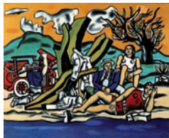
Fernand Léger, La partie de campagne , 1953 Dépôt du MNAM/Centre Pompidou

Dans un premier temps qui correspondrait à celui du cubisme , l'objet manufacturé, en même temps que ses corollaires en amont et en aval, la machine et la publicité, s'insinue dans les esthétiques modernes, au second degré (la représentation) comme au premier (collage). Plus profondément encore, la pensée industrielle qui progresse amène à envisager une modernisation parallèle de la peinture elle-même : c'est l'idée que défend le purisme, réduisant la représentation aux formes géométriques les plus strictes. À quelques décennies de distance, les œuvres de Gino Severini ( Collage au journal Lacerba , 1913), d' Amédée Ozenfant ( Nature morte puriste , 1921) ou de Fernand Léger ( La partie de campagne , 1954) illustrent bien ce nouveau statut et ce nouveau traitement de l'objet dans les avant-gardes de la première moitié du XX e siècle.