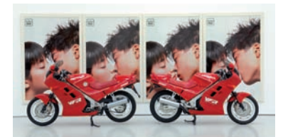
Ange Leccia, Je veux ce que je veux , 1989 Donation Caisse des Dépôts, 2006

Les salles suivantes sont consacrées aux œuvres de Bertrand Lavier , Jean-Luc Vilmouth et Ange Leccia . Ces approches plus contemporaines de l'objet sont représentatives d'un lien plus que jamais ambigu avec lui : attirance ou répulsion, acceptation ou résistance, jouissance ou aliénation de la consommation, qui va jusqu'à la soumission de l'individu lui-même à l'objet qui dicte les règles du temps, de la beauté, du désir.