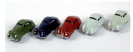
Hans-Peter Feldmann, Sans titre , 1975 Donation Vicky Rémy, 1992

Continuation, variation ou posture critique par rapport au Pop Art, la figuration narrative prend pour motif essentiel les objets de consommation et l'imagerie publicitaire. La voiture, objet de convoitise, symbole à la fois de réussite sociale et d'émancipation, devient quasi idole dans les œuvres de Don Eddy ou plus encore de Peter Stampfli , qui en fait le sujet principal de sa peinture. Dans le dyptique d' Hervé Télémaque , Convergence , 1966, l'objet est partie prenante d'une narration discontinue, comme l'est l'œuvre elle-même, enrichie de collages et d'assemblages d'objets réels.