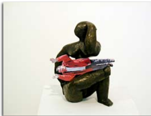
Atelier "Maouss et rikiki".