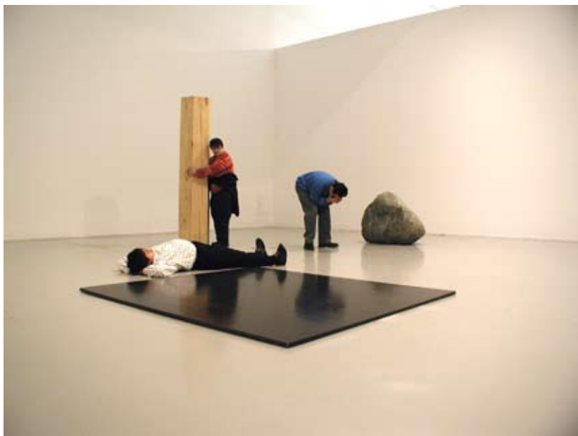
Visite découverte de l'exposition Lee Ufan.

Musée d'art moderne de Saint-Étienne Métropole La Terrasse BP 80241 - 42006 Saint-Étienne cedex 1 Tél. : 04 77 79 52 52 - Web : www.mam-st-etienne.fr