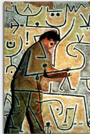
Atelier "Voyage dans un tableau".

Quand le langage des mots est difficile, c'est le langage du corps et des idées qui s'impose.