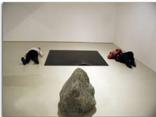
Visite découverte de l'exposition Lee Ufan.