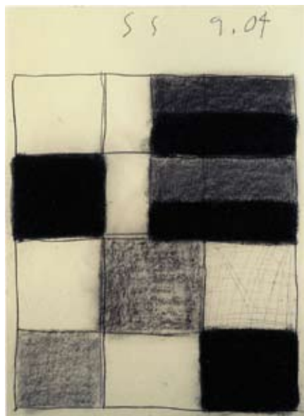
Barcelona 8 #1 9.04.04, 2004. Fusain sur papier. 76 x 56 cm.

Dans les années 1940, Newman développe une peinture caractérisée par des surfaces de couleurs séparées par de fines lignes verticales, des "zips" ("fermetures éclair") comme il les nomme. Dans ses premières œuvres présentant ces "zips", les champs de couleur ne sont pas uniformes, mais par la suite, les couleurs sont pures et plates.