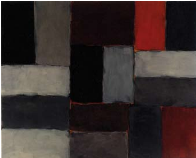
Wall of Light Dusk , 2004. Huile sur toile. 183 x 228 cm. © Sean Scully

C’est par la vibration de la couleur qui suggère un au-delà du visible, par un jeu de présence/absence des formes et par le refus de l’image, que la peinture de Scully s’apparente au sacré.