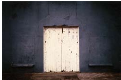
Lost door in Ireland, 1999. 67,9 x 101,6 cm. © Sean Scully.

Il est à noter qu'aujourd'hui Scully utilise la photographie comme point de départ de ses compositions. La patine des vieux murs conditionne sa palette.