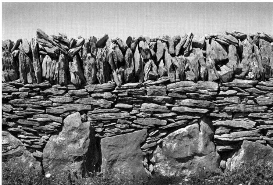
Aran island photograph, 2005. © Sean Scully.

Les termes figurant en gras et suivis d'une astérisque sont définis dans le glossaire, page 16.