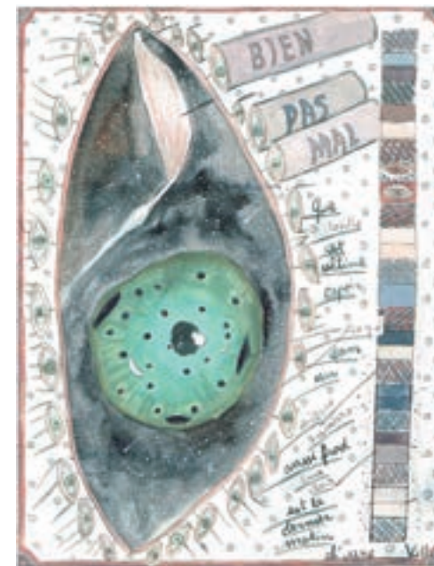
Alexandre Leger, Bien pas mal, 2018, crayon et aquarelle sur papier, 24 x 19 cm.

Le Prix des Partenaires du Musée d'art moderne et contemporain de Saint-Étienne Métropole est décerné par un jury composé de directeurs d'institutions culturelles, de journalistes, de mécènes et de commissaires d'exposition. Créé en 2009, ce prix défend le travail d'un artiste émergent en matière d'arts graphiques vivant en France.