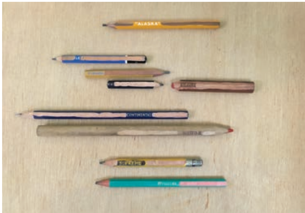
Alexandre Leger, Alaska, 2018, crayons à papier taillés, dimensions variables. Courtesy de l'artiste et Galerie Bernard Jordan, Paris.

Avec une forme de rituel dans le choix du papier, ancien ou usagé, maculé de petits ou de grands carreaux, Alexandre Leger nous expose ainsi phénomènes naturels ou sentiments humains les plus tourmentés, constatant froidement des dysfonctionnements, quelque chose de « malade ».